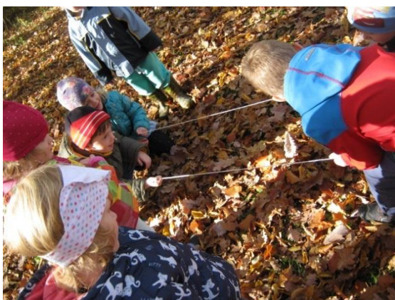
Slika 24: Primerjava dolžine vrvic med seboj

Otroci so se razdelili v pare. V gozdu so izbrali drevo, z vrvico skupaj izmerili njegov obseg in izmerjene dolžine vrvic primerjali med seboj.