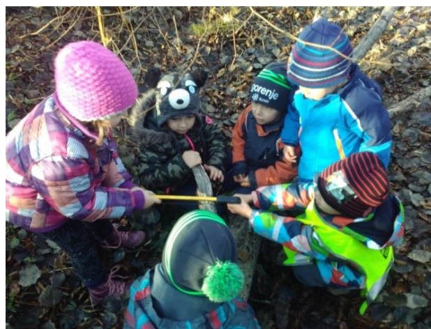
Slika 36: Žaganje suhih vej