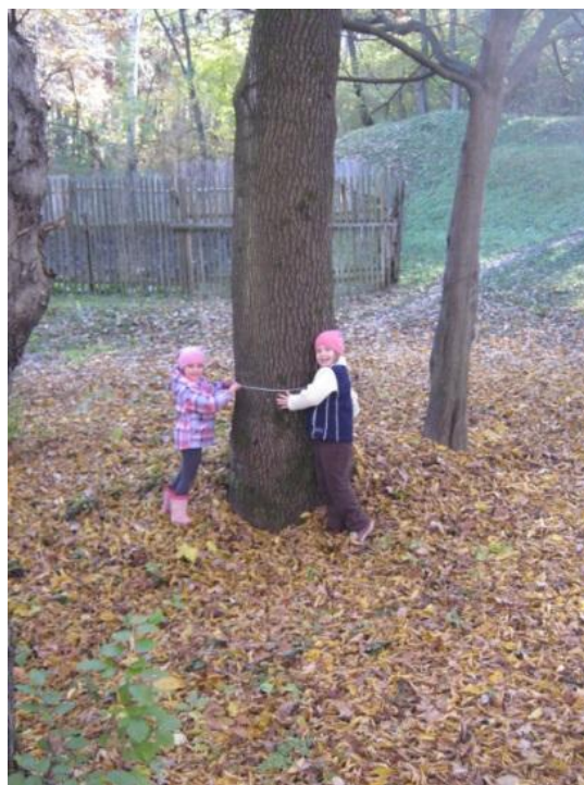
Slika 26: Najino drevo