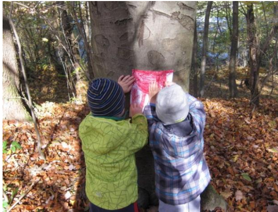
Slika 27: Odtiskovanje drevesnega lubja

Tudi ta igra je potekala v paru. Par si je izbral drevo, na katerega je prvi položil list, drugi pa je z voščenko porisal list papirja. Na listu so nastali odtisi drevesnega lubja. Pri tej igri posamezniki so posamezniki pokazali veliko mero vztrajnosti.