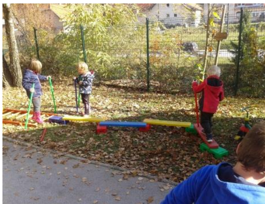
Slika 1: Poligon na igrišču

V gozdu smo skupaj določili prostor, namenjen gozdni igralnici in dogovorili pravila, ki so zagotavljala varno igro in raziskovanje. Naše tedenske obiske v naravnem okolju (igrišče, travnik, gozd, gozdna jasa, gozdni rob, bližnji hrib) smo izvajali vsak torek, ki smo ga skupaj poimenovali »GOZDNI TOREK«.