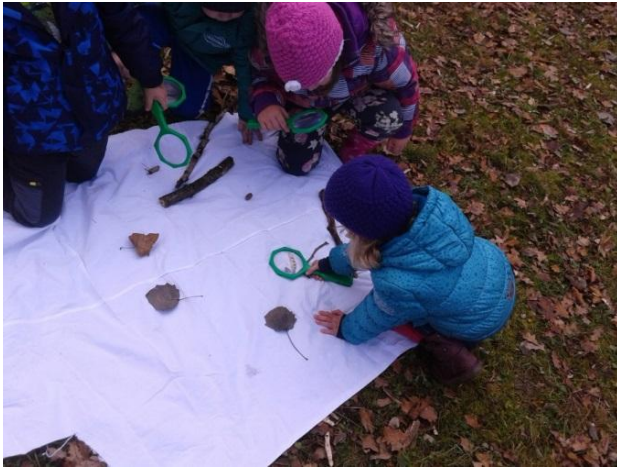
Slika 28: Kaj najdemo na gozdnih tleh?