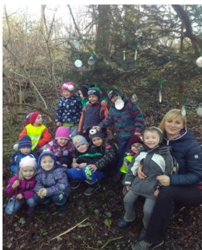
Slika 35: Skupinska fotografija ob okrašeni smrečici

»Mogoče se bo medved kr ustrašu, ko se bo ponoč svetl, pa bo zbežal« (JULIJAN, 5 let in pol)