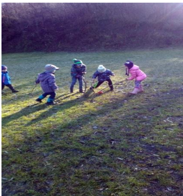
Slika 13: Hokej na travniku