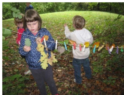
Slika 23: Pestrost jesenskega listja na vrvi