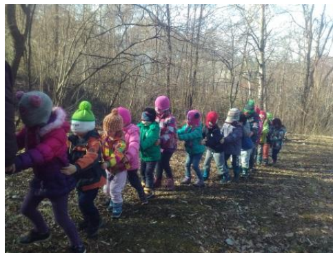
Slika 11: Igra: Gosenica

V začetku so imeli nekateri otroci težave, saj so se osredotočali na občutke, ki so jim bili novi ali celo neprijetni. A ob zaupnem medsebojnem sodelovanju, je postala igra prijetna in zabavna.