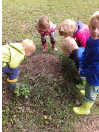
Slika 30: Mravljišče in življenje v njem

» Sam , ka pa, če bo notr kak pajk zlezu?« (GAŠPER, 3 leta)