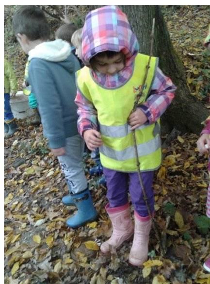
Slika 33: Do kam bi segala voda ?