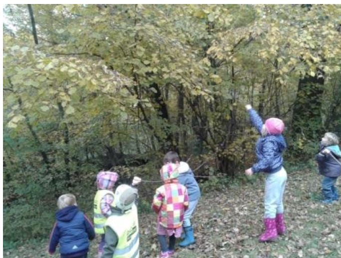
Slika 14: Razvijanje skočne moči