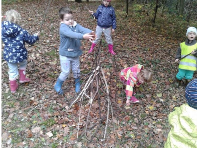
Slika 18: »Hiška za ježka«

Otrokom sva omogočili svobodno igro z naravnimi materiali v gozdu. Tako so 3 otroci prišli na idejo, da naredimo »hiško za ježka«. Akcija prinašanja različnih naravnih materialov (lubja, storžev vej, listov,..) in postavljanja v »hiško« se je pričela.