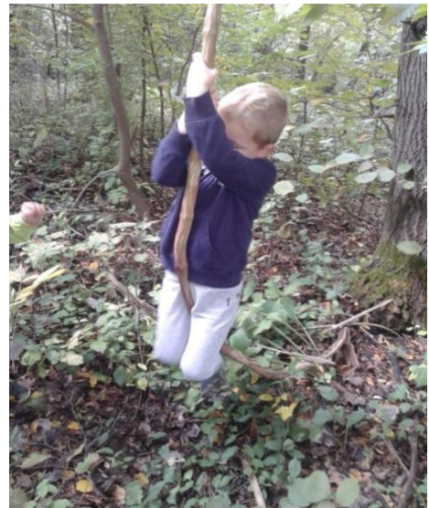
Slika 7: Ovijalke- gibalni izzivi