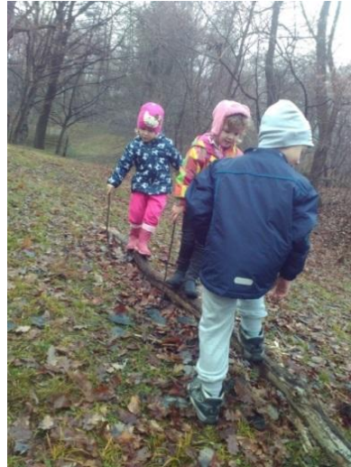
Slika 10: Hoja po podrtem drevesu

Z gibanjem so otroci spoznavali svoje telo in preizkušali kaj zmorejo. Gibanje jim je bilo vedno znova v izziv. Tudi mlajši otroci so pokazali veliko mero iznajdljivosti. Pri hoji po podrtem drevesu so si pomagali s polomljenimi vejami iz dreves in s pomočjo njih lovili ravnotežje.