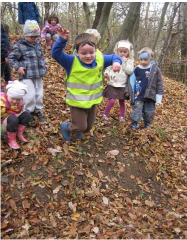
Slika 2: Skoki v globino

Hoja po vzpetini, strmem pobočju, različnih terenih, plazenje med različnimi naravnimi ovirami, skoki v globino in daljino (v kupe listja), valjanje po različnih površinah,..)