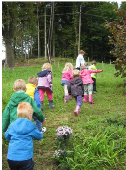
Slika 5: Hoja po vzpetini

Ob vsakem ponovnem obisku gozda ali travnika so otroci iskali različne možnosti gibanja. Pri tem so takoj začeli z igro in bili čisto vsi gibalno ali miselno aktivni.