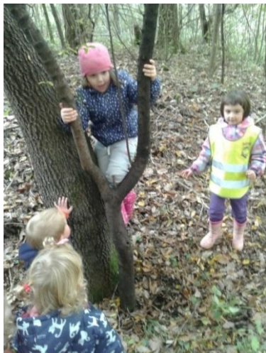
Slika 8: Plezanje na drevo (Foto: Ašenberger)