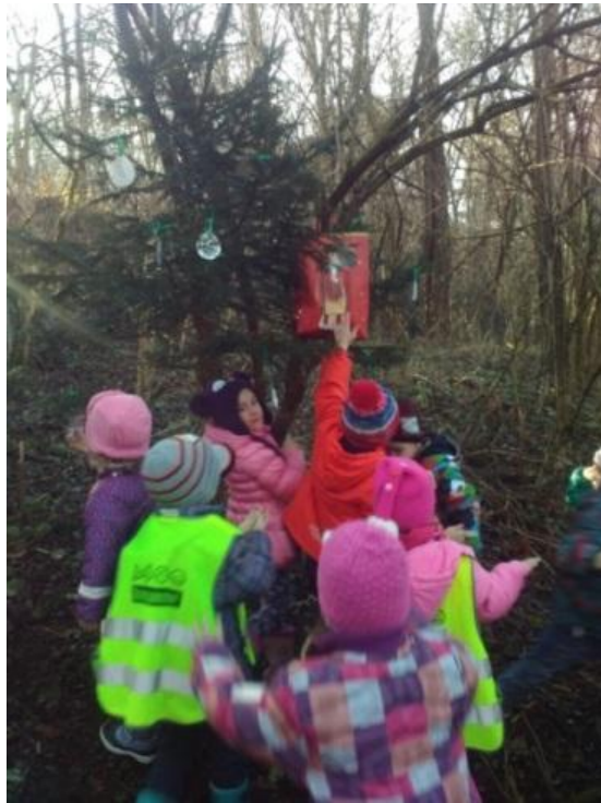
Slika 37: Presenečenje v gozdu