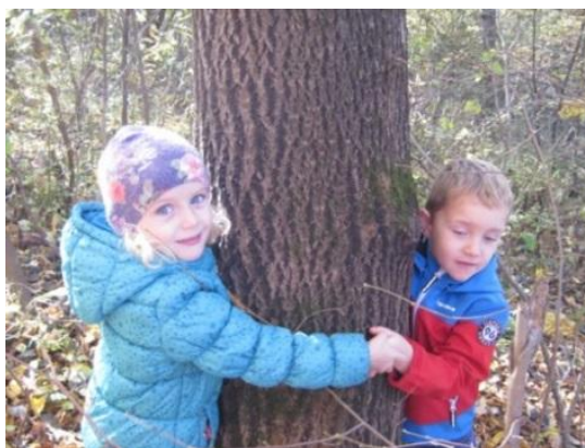
Slika 21: Najino drevo

Veš, men je tistle všeč, ko je najbolj visoko, pa sova v njem spi-v votlini tamle gor (GAŠPER, 3 leta)