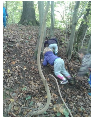
Slika 4: Plazenje