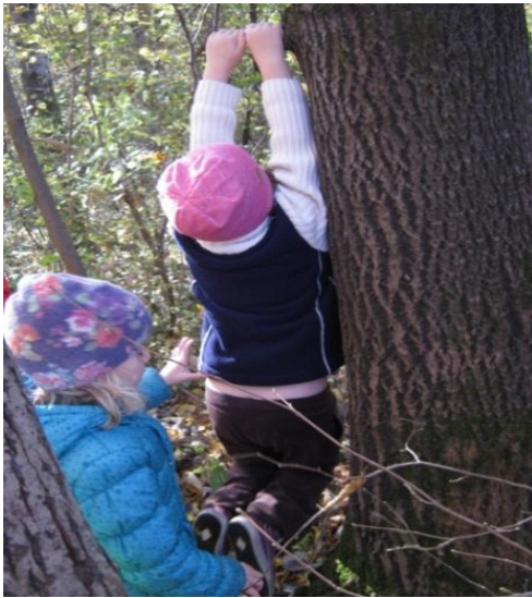
Slika 6: Visenje na drevesnih vejah

Ob prihodu v naravo sva vsakokrat znova otrokom omogočili raziskovanje narave. Tako so otroci velikokrat sami, nevede, reševali nastale gibalne probleme in pridobivali več samozaupanja. Imeli so najrazličnejše ideje in si med seboj pomagali z nasveti.