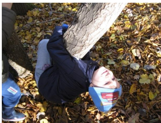
Slika 9: »Veseli netopir«

Z gibanjem in raziskovanjem v naravi sem otrokom vsakodnevno omogočala, da z različnimi dejavnostmi na prostem spoznajo in razvijajo gibalne sposobnosti ter usvojijo nekatere gibalne koncepte. Pri izvajanju le teh je bila tudi moja vloga in vloga sodelavke v oddelku zelo pomembna. Skrbeli sva za varnost, otroke spodbujali, usmerjali, pomagali, jim demonstrirali, z njimi sodelovali, se igrali in se tudi sami učili.