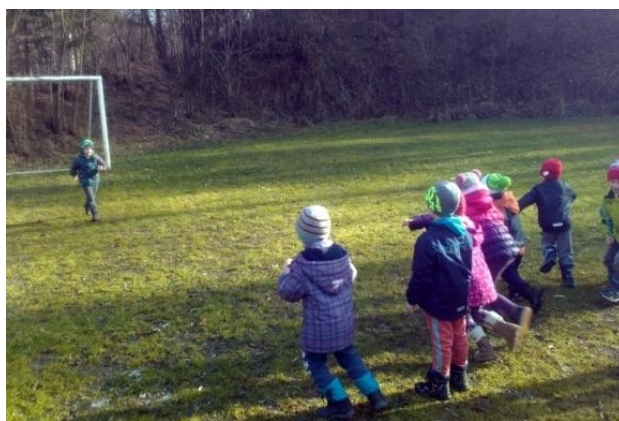
Slika 15: Igra: Lisica, kaj rada ješ?