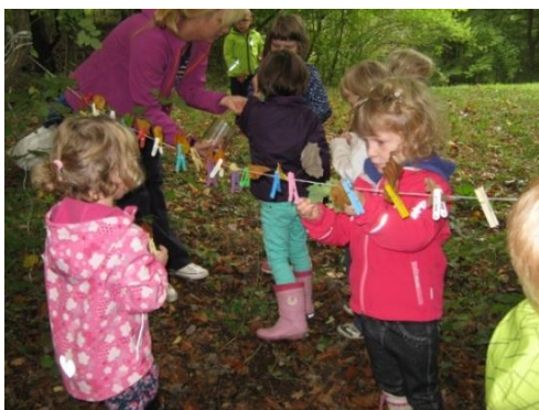
Slika 22: Gozdna razstava