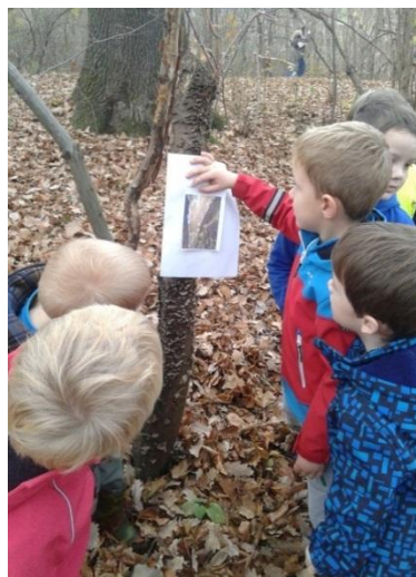
Slika 20: Primerjava fotografije z realnostjo