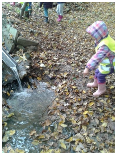
Slika 32: Preverjanje globine

Izvedli smo tudi eksperiment, s katerim smo izmerili globino vode. Deklica je poiskala primerno palico, jo potisnila v vodo. Nato smo skupaj primerjali, do kam bi ji voda segala, če bi vanjo stopila sama? Ugotovili smo, da skoraj do kolen. V zimskih mesecih pa je potoček spremenil tudi svoja agregatna stanja. Opazovali smo kristale, v katere se je tekoča voda spremenila in preizkušali trdnost ledu na površju.