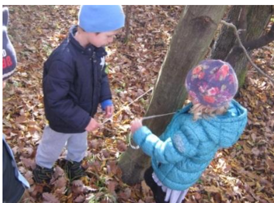
Slika 25: Merjenje obsega izbranega drevesa