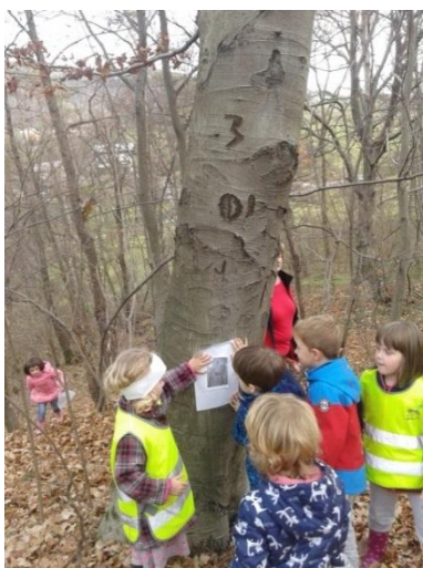
Slika 19: Opazovanje podrobnosti

Pri tej igri so bili posamezniki zelo dobri opazovalci. Še posebej so bili ponosni, ko so dejansko drevo ali rastlino našli, zato so k drevesu vabili še ostale prijatelje in skupaj so besedno komentirali svoja opažanja.