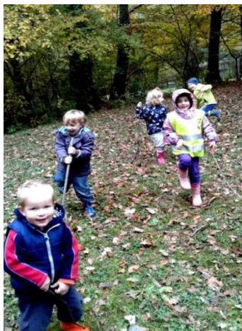
Slika 12: Razgibavanje z naravnim materialom

Kot gibalni pripomoček smo večkrat uporabili tudi naravne predmete iz okolja, s katerimi so imeli otroci možnost manipulacije na različne načine, izvajanja določenih gibalnih motivov in demonstriranja lastnih. Tako je na najino pobudo na gozdni jasi nastal tudi naravni poligon, ki smo ga sestavili skupaj z otroci. S tem so imeli možnost participacije in bili še bolj notranje motivirani pri gibalni dejavnosti.