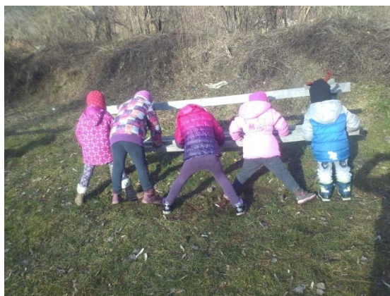
Slika 16: Gibalna minuta med sprehodom

Čeprav otrokom vsakodnevno omogočam in jih spodbujam, da z različnimi dejavnostmi v prostoru in na prostem spoznavajo in razvijajo gibalne sposobnosti (jutranje razgibavanje, gibalne igre, gibalne minute, vadbene ure, sprehodi,...), smo tudi sprehode v naravi večkrat popestrili z gibalnimi vložki, ob kateri so se otroci sprostili in svoje telo uporabljali kot izhodiščno točko za presojo položaja, smeri in razmerja do drugih.