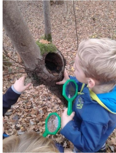
Slika 29: Kaj se skriva v luknjici?