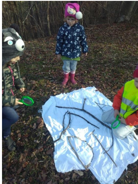
Slika 31: Igre s črkami

Iskanje vej, listov in zaznavanje podobnosti veja- črka. Posamezniki so želeli in sestavili iz najdenih vej tudi svoje ime.