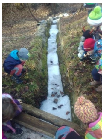
Slika 34: Opazovanje kristalov