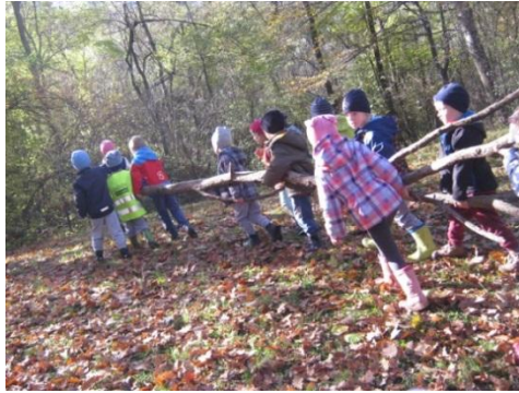
Slika 17: Čistimo gozd