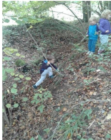
Slika 3: Gibanje po razgibanem terenu