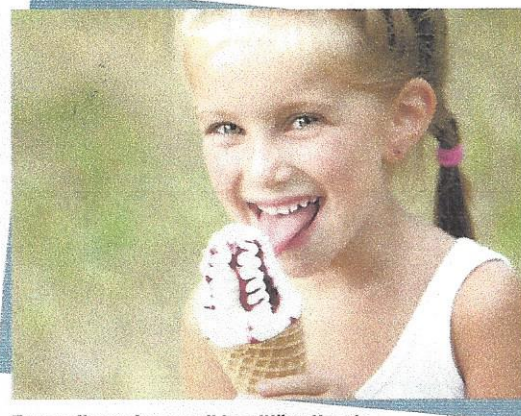
Za razgibavanje govora je odlično lizanje sladoleda. Otroka spodbujamo, da se polžiže tudi okrog ust.

ustrezne strategije, s katerimi jih bomo odpravili ali vsaj omilili in s tem otroku omogočili čim bolj uspešen govorno-jezikovni razvoj. S pravnim ravnanjem lahko veliko govorno-jezikovnih težav odpravimo že pred vstopom v šolo, nekatere pa žal vztrajajo tudi še v odrasli dobi. Kakor koli že pa smo vsi popolni v svojih nepopolnostih. ●