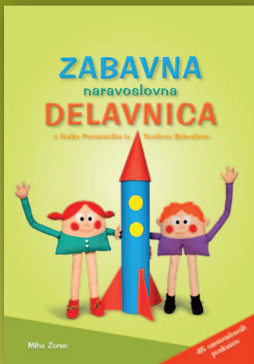
96 strani, 21 × 29,7 cm