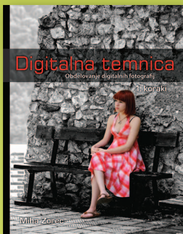
192 strani, 21 × 29,7 cm