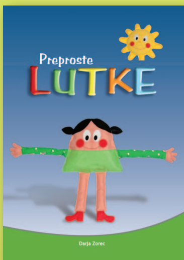
48 strani, 21 × 29,7 cm